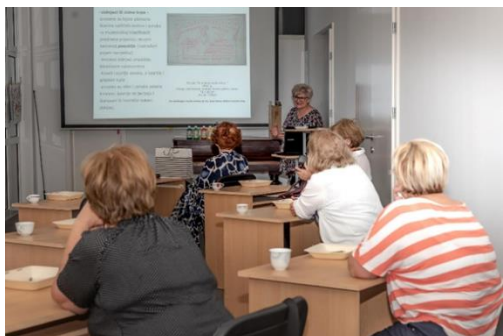
„Zidnjaci naši negdašnji“, predavanje, 25.5.2022.