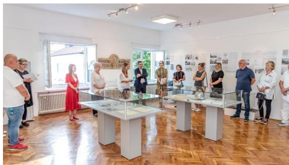
Kotar Čazma (1872.) 1895.-1955. – predavanje uz otvaranje izložbe 13.7.2022.